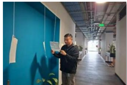
Sensibilización Galería fotográfica sobre casos de corrupción relevantes en Colombia