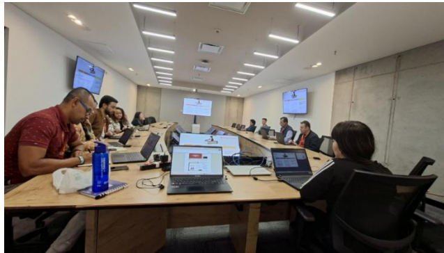
Socialización de los lineamientos del PTEP (20 de marzo 2026)

Del 16 al 20 de marzo de 2026, se llevó a cabo la Semana de la Transparencia, una iniciativa de la Oficina Asesora de Planeación, diseñada para fortalecer la cultura de la integridad dentro de la entidad. Durante esta jornada, se desarrollaron diferentes actividades de sensibilización enfocadas en la legalidad, en la prevención de la corrupción y en la apropiación del Programa de transparencia y ética pública