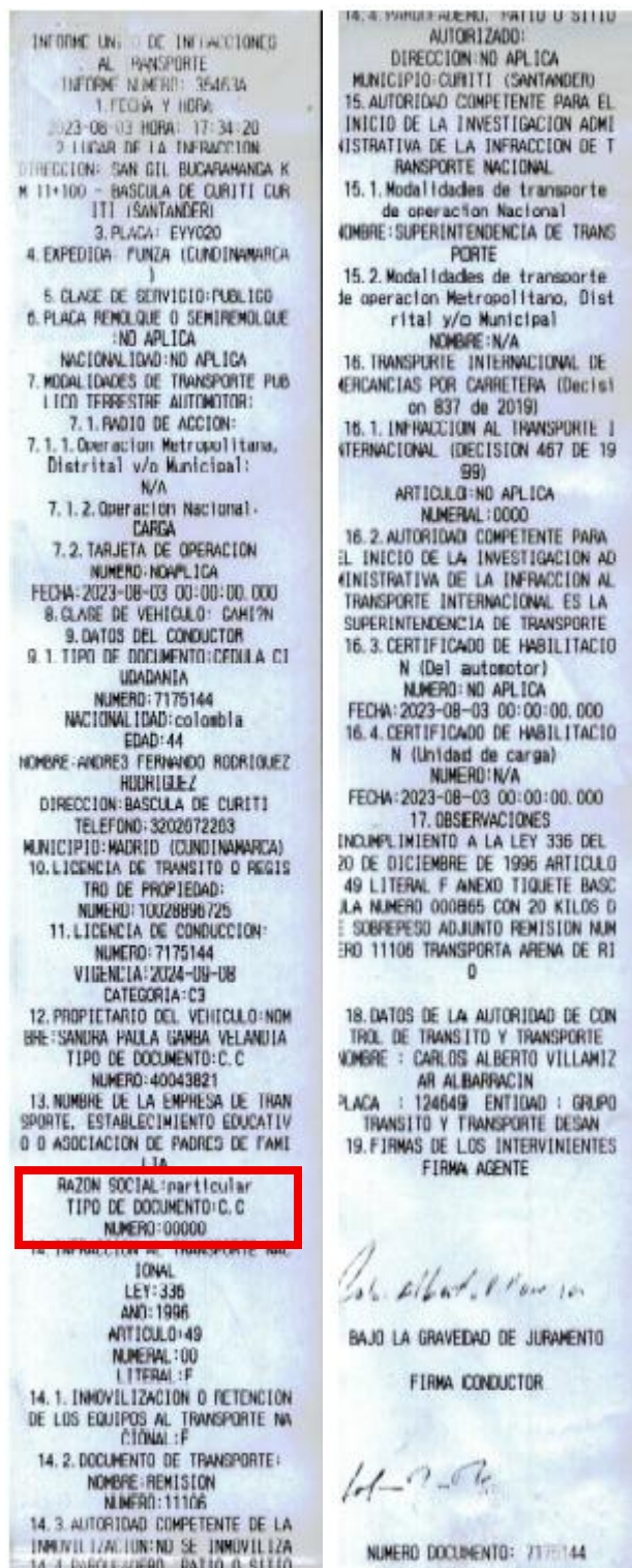
Imagen 1. IUIT No. 35463A del 03/08/2023

A partir de lo consignado en el Informe Único de Infracciones al Transporte No.35463A del 03/08/2023, concretamente en la casilla 13 no se consignó la razón social o número de identificación tributaria que permita individualizar la presunta empresa infractora.