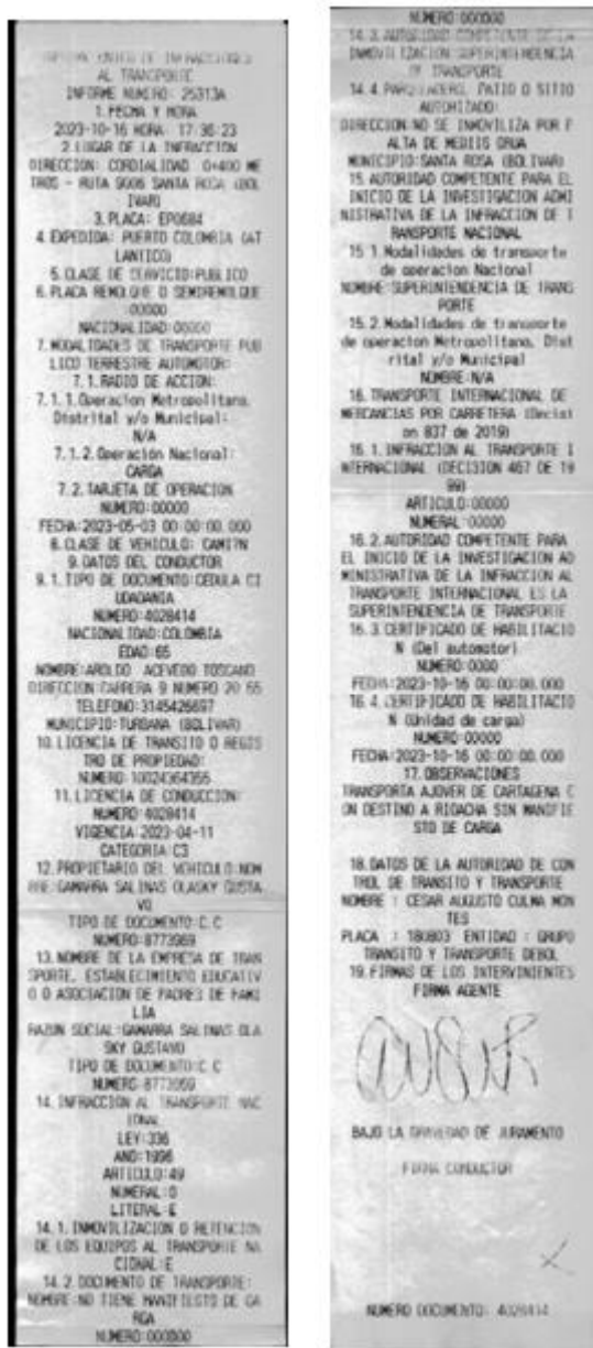
Imagen 1. Informe Único de infracciones de transporte No. 25313A del 16/10/2023, aportado por la DITRA.

"Por la cual se archiva un informe único de infracción al transporte"