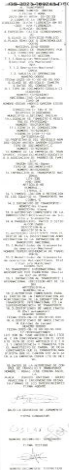
Imagen 1. Informe Único de Infracciones al Transporte No. 36674A del 10/08/2023, aportado por la DITRA.

Mediante Informe Único de Infracciones al Transporte No. 36674A del 10/08/2023, el agente de tránsito impuso infracción al vehículo de placas SKI545 debido a que conforme a lo descrito en la casilla de observaciones (...) INEXISTENCIA Y TRANSITA SIN EL MANIFIESTO DE CARGA. SE DEJA CONSTANCIA QUE EL CONDUCTOR MANIFIESTA QUE EL CAMION EST AFILIADO A LA EMPRESA OSPER LTD DE NEIVA ", como se vislumbra a continuación: