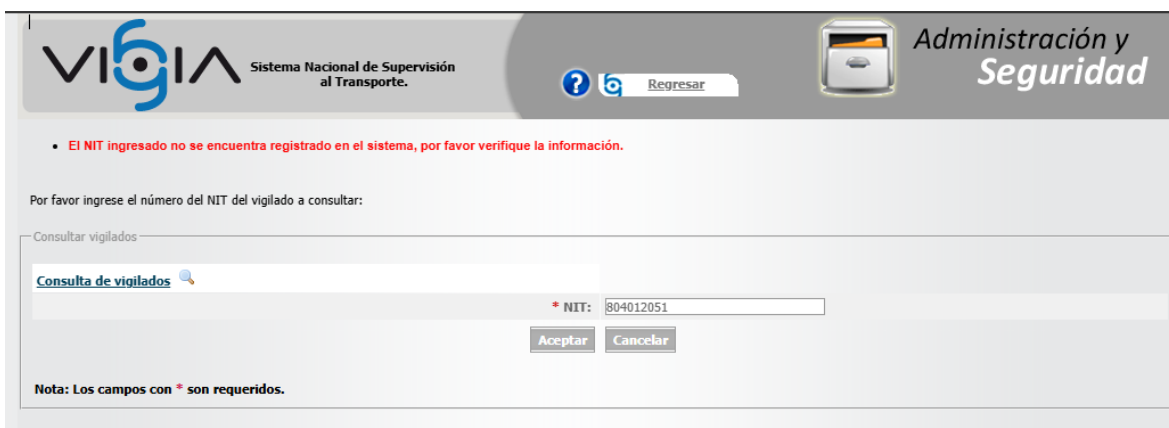
Imagen 4. Resultado de la consulta con el NIT. 804012051-en el aplicativo VIGIA Sistema Nacional de Supervisión al Transporte

Que, conforme a la precitada averiguación preliminar efectuada por este Despacho, no se logra tener certeza respecto de la empresa encargada de la operación de transporte desarrollada para el día 03 de agosto de 2023, por parte del vehículo de placas XVN429, y en ese sentido, sobreviene una duda razonable respecto al presunto infractor; por lo que, para este Despacho no existe el material probatorio pertinente y conducente que nos permita verificar si es posible la apertura de una actuación administrativa sancionatoria por parte de esta Superintendencia.