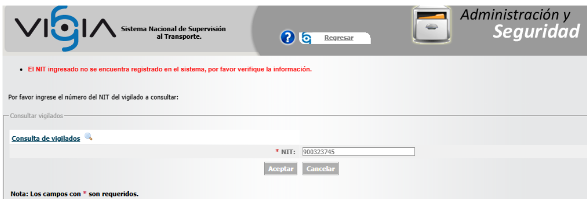
Imagen 4. Resultado de la consulta con el NIT. 900323745 en el aplicativo VIGIA Sistema Nacional de Supervisión al Transporte

Que, conforme a la precitada averiguación preliminar efectuada por este Despacho, no se logra tener certeza respecto de la empresa encargada de la operación de transporte desarrollada para el día 03 de agosto de 2023, por parte del vehículo de placas XVY021, y en ese sentido, sobreviene una duda razonable respecto al presunto infractor; por lo que, para este Despacho no existe el material probatorio pertinente y conducente que nos permita verificar si es posible la apertura de una actuación administrativa sancionatoria por parte de esta Superintendencia.