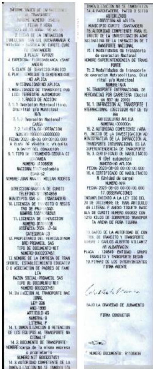
Imagen 1. IUIT No. 35461A del 03/08/2023

Mediante Informe Único de Infracciones al Transporte No. 35461A del 03/08/2023, el agente de tránsito impuso infracción al vehículo de placas XVY021 debido a que conforme a lo descrito en la casilla de observaciones (...)” INCUMPLIMIENTO A LA LEY 336 DEL 20 DE DICIEMBRE DE 1996 ARTICULO 49 LITERAL F ANEXO TIQUETE BASCULA DE CURITI NUMERO 000832 CON 1210 KILOS DE SOBREPESO TRANSPORTE ARENA DE TIERRA ”, como se vislumbra a continuación: