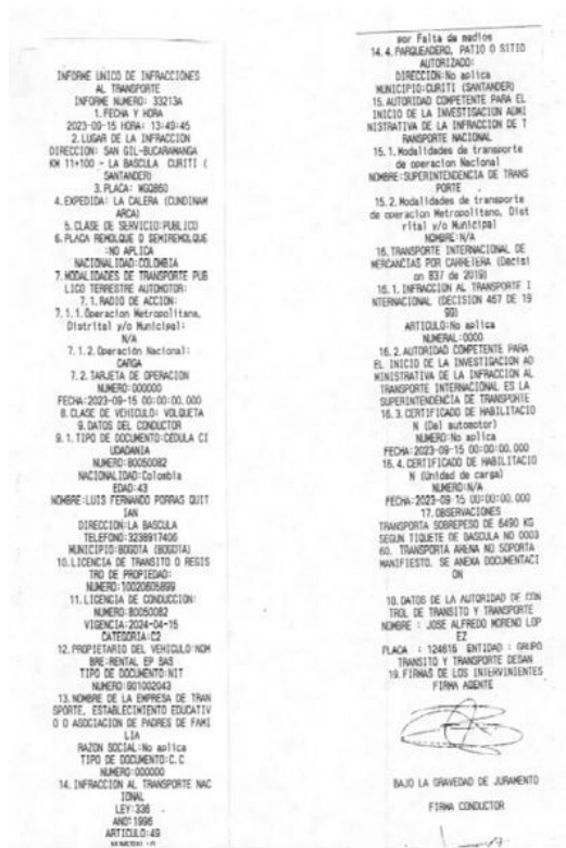
Imagen 1. Informe Único de infracciones de transporte No. 33213A del 15/09/2023, aportado por la DITRA.

"Por la cual se archiva un informe único de infracción al transporte"