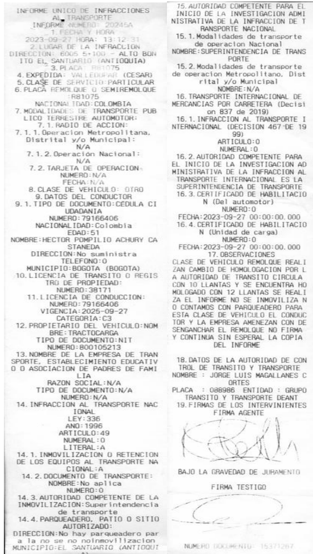
Imagen 1 Informe único de infracciones al transporte No. 20245A del 27/09/2023 aportado por la DITRA

En el caso concreto, si bien el agente de tránsito consignó en el IUIT un presunto cambio en las condiciones de homologación del vehículo, el material fotográfico aportado no permite verificar objetivamente dicho incumplimiento frente a la información registrada en el RUNT. En consecuencia, este Despacho carece de elementos de juicio y material probatorio suficiente para determinar con certeza que la empresa alteró las condiciones de homologación del automotor en cuestión.