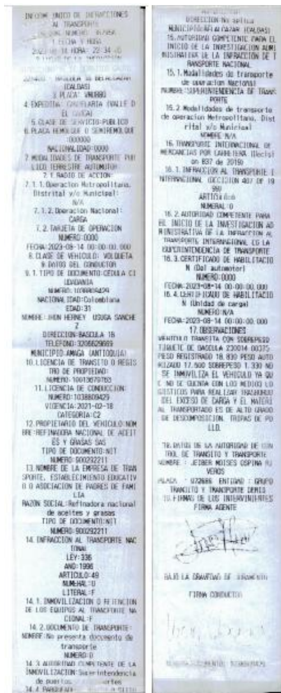
Imagen 1. IUIT No. 36795A del 14/08/2023

LOGISTICOS PARA REALIZAR TRASBORDO DEL EXCESO DE CARGA Y EL MATERIAL TRANSPORTADO ES DE ALTO GRADO DE DESCOMPOSICION. TRIPAS DE POLLO", como se vislumbra a continuación: