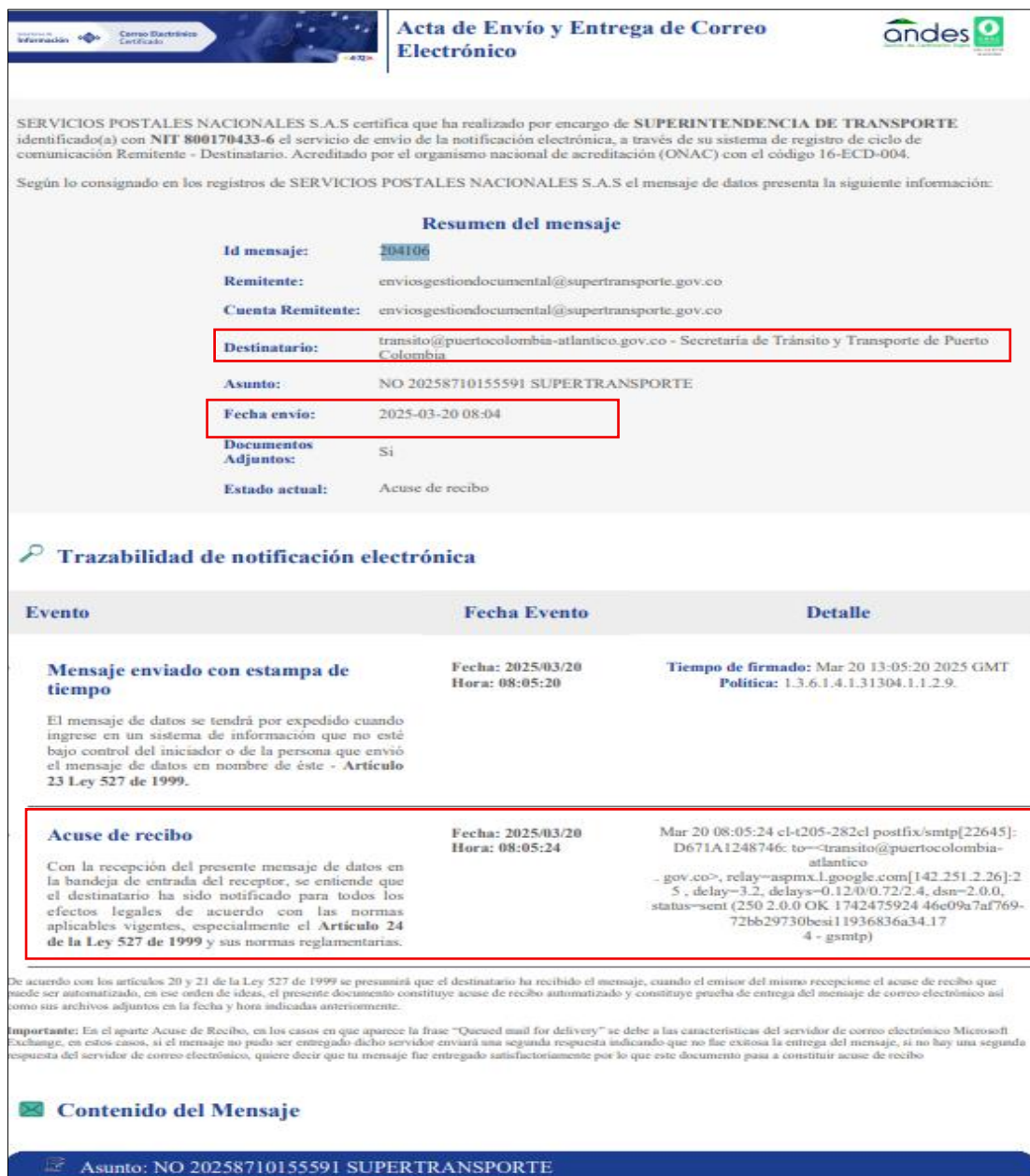
Imagen No. 1. Soporte de envío y de entrega del Oficio de Salida No.20258710155591 del 19 de marzo de 2025.

Bajo este entendido, la Investigada contaba con un término de diez (10) días hábiles, contados a partir del día siguiente a la comunicación del requerimiento, los cuales finalizaron el 04 de abril de 2025 . Revisado el sistema de gestión documental de la Entidad, se observó que la SECRETARÍA DE TRÁNSITO Y TRANSPORTE DE PUERTO COLOMBIA identificada con NIT No.800.094.386-2 , no otorgó respuesta al requerimiento de información.