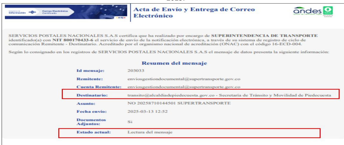
Imagen No.1. Soporte de envío y de entrega del Oficio de Salida No.20258710144501 del 13 de marzo de 2025.

Bajo este entendido, la Investigada contaba con un término de diez (10) días hábiles, los cuales finalizaron el 28 de marzo de 2025 . Revisado el sistema de gestión documental de la Entidad, se observó que la SECRETARÍA DE TRÁNSITO Y MOVILIDAD DE PIEDECUESTA con NIT No.890.205.383-6 , no otorgó respuesta al requerimiento de información.