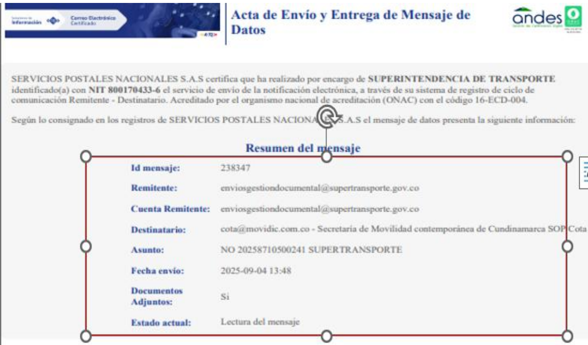
Imagen No.3. Soporte de envío y de entrega del Oficio de Salida No.20258710500241 del 04/09/2025.- correo electrónico: contactenos@cundinamarca.gov.co