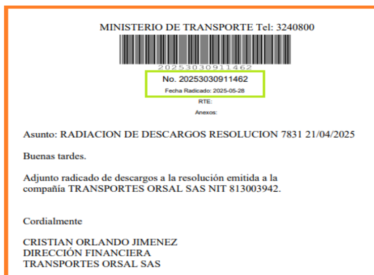
Imagen 1. Radicado No. 20253030911462 del 28 de mayo de 2025 ante el Ministerio de Transporte.

Del documento allegado se evidencia que se aportaron las siguientes pruebas: