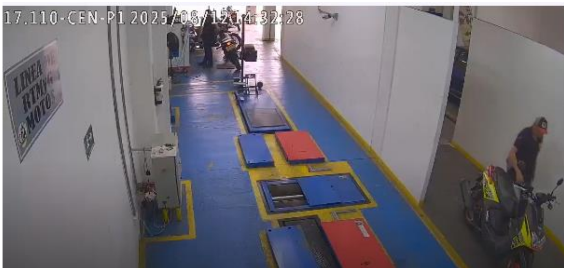
Imagen No.3. Tomada del informe allegado por Indra y la Dirección de Promoción y Prevención de Tránsito y Transporte Terrestre de esta Superintendencia, mediante el cual se informa los hallazgos al analizar el video frente al proceso de inspección llevado a cabo por CDA CHINCHINA SOLO MOTOS al vehículo de placas VRJ81E.

Aunado a lo anterior, esta Dirección procedió a revisar el Formato Único de Resultados de la Revisión Técnico Mecánica y Emisión de Gases Contaminantes del vehículo de placas VRJ81E observando que, manipulación del equipo luxómetro durante la prueba de luces, no se evidencia aceleración de la motocicleta durante la prueba, no se evidencia adecuado posicionamiento del equipo (paralelismo).