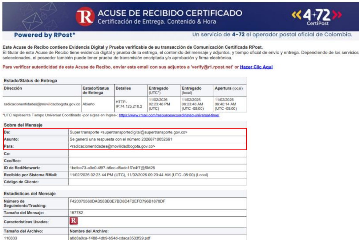
Imagen No.5. Soporte de envío y de entrega del Oficio de Salida No.20268710052661 del 11 de febrero de 2026, correo electrónico: radicacionentidades@movilidadbogota.gov.co

Frente a esta reiteración, la Investigada contaba con un término de cinco (05) días, los cuales finalizaron el día 18 de febrero de 2026 . Revisado el sistema de gestión documental de la Entidad, se observó que la SECRETARÍA