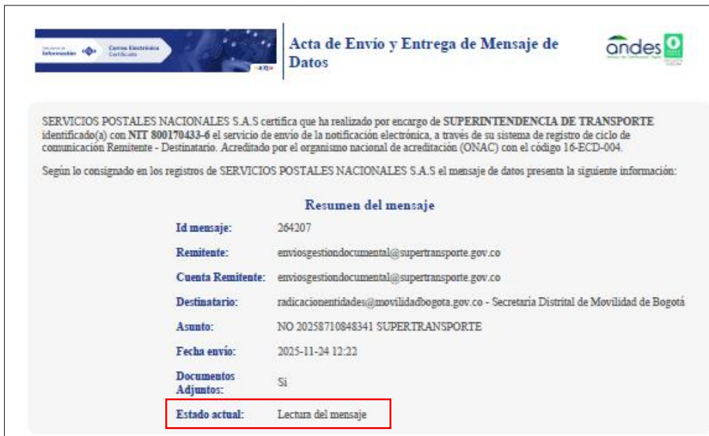
Imagen No.1. Soporte de envío y de entrega del Oficio de Salida No.20258710848341 del 24 de noviembre de 2025, correo electrónico: radicacionentidades@movilidadbogota.gov.co

De lo expuesto, es importante resaltar que el oficio de salida No. 20258710848341 fue comunicado el 24 de noviembre de 2025 mediante el Acta de Envío y Entrega de Mensaje de Datos No.264207, remitido al correo radicacionentidades@movilidadbogota.gov.co .Dicho envío cuenta con constancia de apertura por parte del destinatario, como se evidencia a continuación: