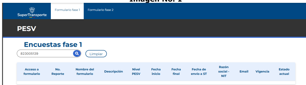
Imagen No. 1