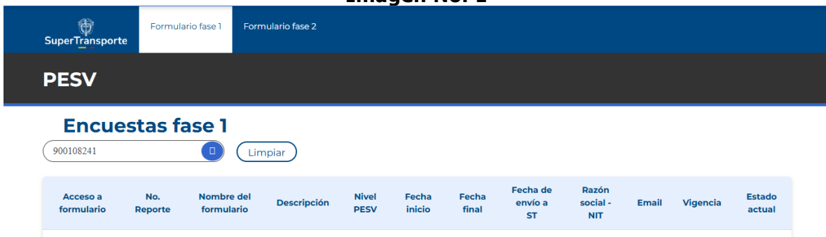
Imagen No. 1