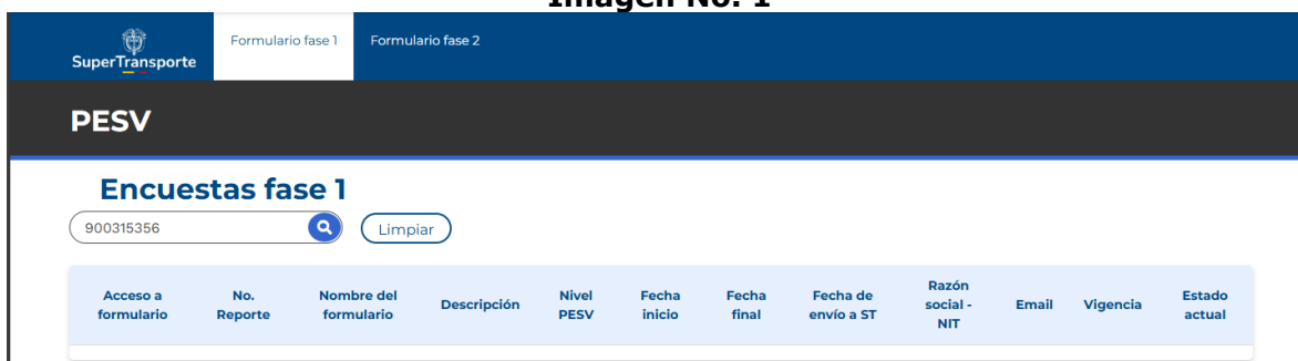
Imagen No. 1