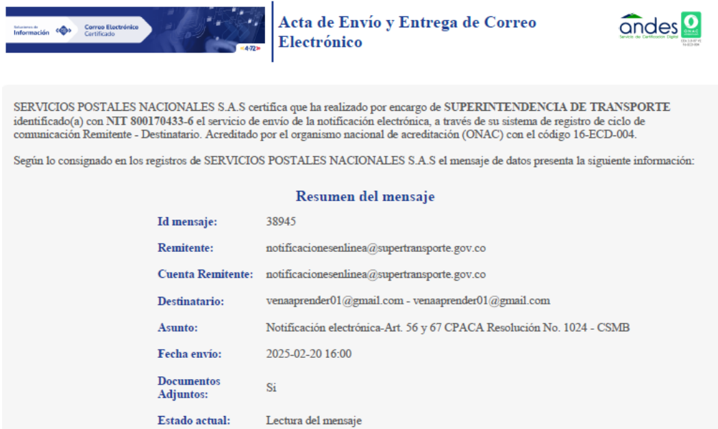
Imagen 1: Acta de Envío y Entrega de Correo Electrónico con Id mensaje: 38945.