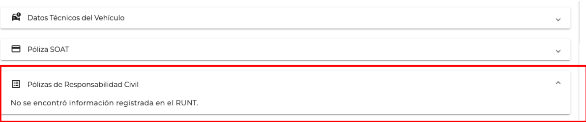
Imagen No.2. Consulta trasversal en plataforma CEMAT y RUNT.

De acuerdo con lo anterior, se realizó la consulta transversal en las plataformas CEMAT y RUNT, a fin de verificar la información registrada en el IUIT, específicamente basados en la placa del vehículo. En efecto, se constató que, al momento de los hechos, el vehículo en cuestión no contaba con póliza de responsabilidad civil, en consecuencia se imposibilito la identificación clara de la empresa responsable , como se evidencia a continuación: