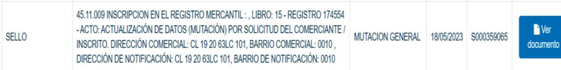
Imagen No.4 Captura de pantalla- Tomada de Consulta Virtual de Expedientes Registro único empresarial y social RUES , CENTRO DE ENSEÑANZA AUTOMOVILISTICA PRACTICAR DUITAMA S.A.S, identificada con NIT No.901496267-6, Denominado "Mutación General".

Así mismo este Despacho pudo evidenciar que de acuerdo con la información reportada al Registro único empresarial y social (RUES) y consultada en el expediente del mismo, la sociedad CENTRO DE ENSEÑANZA AUTOMOVILISTICA PRACTICAR DUITAMA S.A.S , identificada con NIT No.901496267-6 en calidad de propietaria del establecimiento de comercio CENTRO DE ENSEÑANZA AUTOMOVILISTICA PRACTICAR DUITAMA S.A.S , identificado con matrícula mercantil No.104897 , realizó acto de actualización de datos el día 18 de mayo de 2023, no obstante dicha actualización no fue reportada al Ministerio de transporte como se evidencia a continuación: