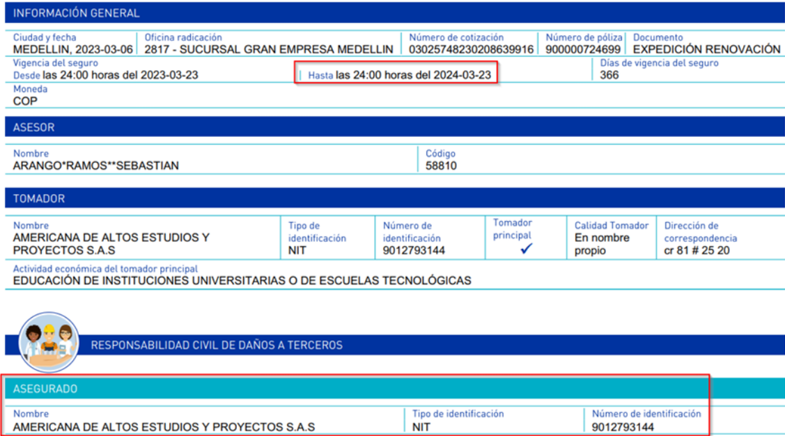
Imagen No.4. Tomada del radicado No. 20245341018012 de 07 de mayo de 2024.

En virtud de la información e imágenes allegadas por parte de OLIMPIA IT S.A.S , esta Dirección considera que, presuntamente la sociedad AMERICANA DE ALTOS ESTUDIOS Y PROYECTOS SAS , con NIT No.901279314 - 4 , como propietaria del establecimiento de comercio CEA AMERICAN DRIVER , con matrícula mercantil No.137767 con ID RUNT No.19341720 , desde el 23 de marzo de 2024 no mantiene vigente la póliza de responsabilidad civil extracontractual, siendo esta una exigencia previa de habilitación.