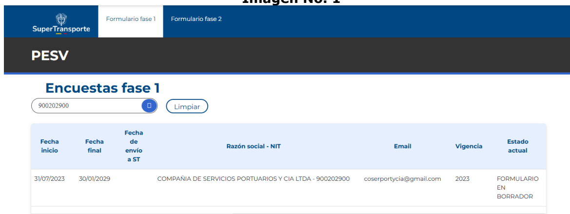
Imagen No. 1