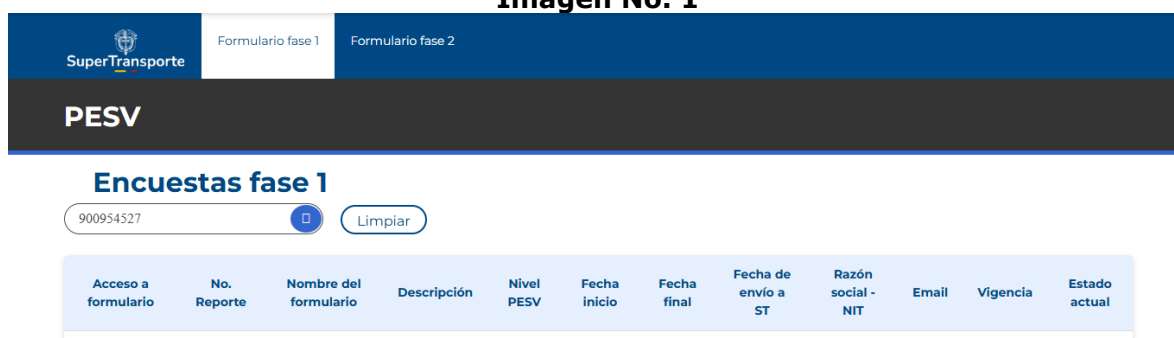
Imagen No. 1