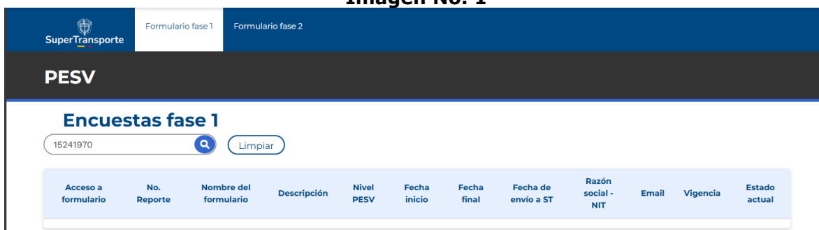
Imagen No. 1