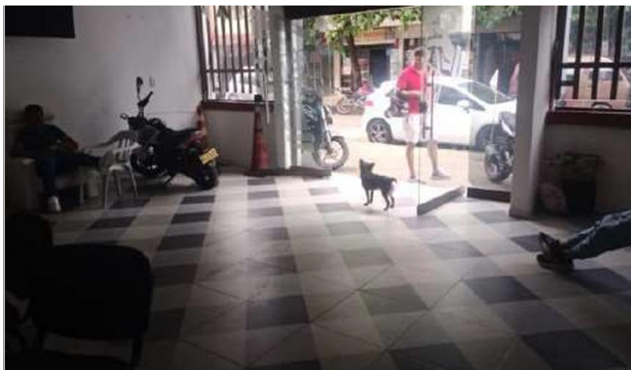
Imagen No. 1. Evidencia validación de aulas informe de visita de fecha 5-03-2024.

como aula de formación, pues, se encontraba funcionando como sala espera y punto de información comercial del CEA, tal y como se logra evidenciar en la imagen que fue incorporada dentro del informe de visita allegado: