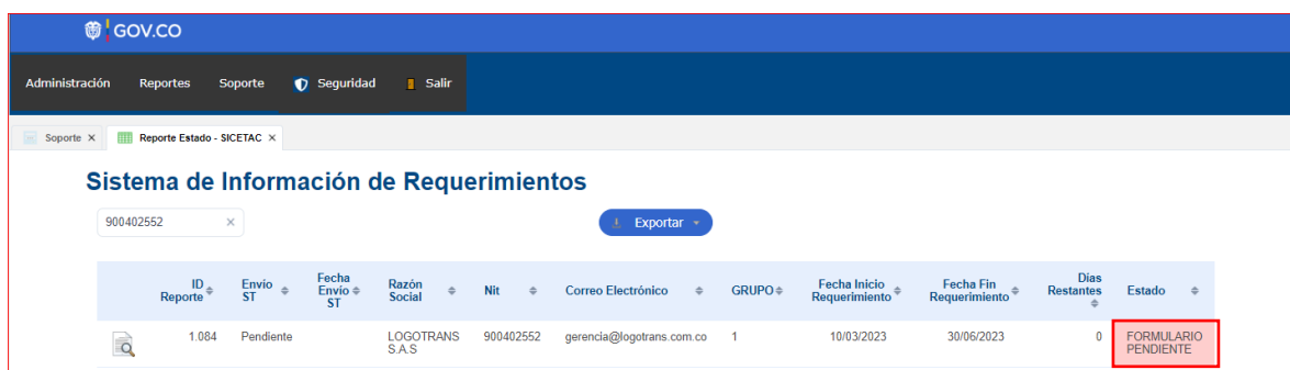
Ilustración 2 Consulta en el link https://aplicaciones.supertransporte.gov.co/SIR_ST/app_Login/ , reporte de estado SICE TAC.