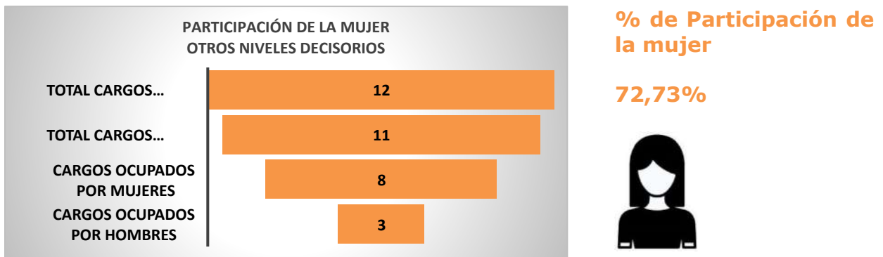
Imagen 2. Provisión de Cargos de Otros Niveles Decisorios a 31 de julio de 2024