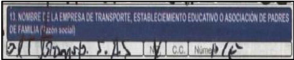
Imagen No. 1 Captura de pantalla IUIT B08001004220A del 03/12/2022

Que, en el presente caso, tenemos que mediante radicado No. 20235341873952 del 04/08/2023, se allegó el informe Único de Infracción al Transporte No. B08001004220A del 03/12/2022 , impuesto al vehículo de placa STX896 , dejando incompleta la información del sujeto infractor, y la siguiente observación en la casilla No. 17, tal como se evidencia a continuación: