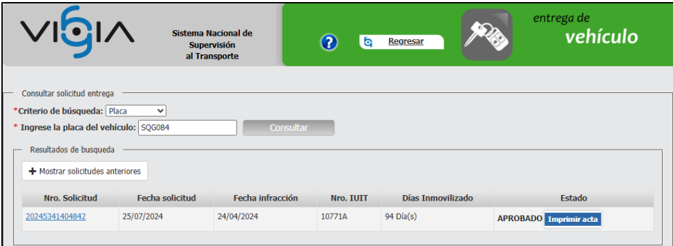
Imagen 2. Consulta ST realizada al link http://vigia.supertransporte.gov.co en el aplicativo VIGIA- Solicitud de salida No. 20245341404842, correspondiente al 25/07/2024

Ahora bien, este Despacho con el fin de identificar debidamente el sujeto activo de la infracción, procedió a verificar la plataforma VIGIA - sistema Nacional de Supervisión al Transporte - en el módulo de "consultas solicitud de inmovilizaciones", utilizando como criterio de búsqueda la placa SQG084, resultado el cual arrojó, una solicitud de salida de vehículo con radicado No. 20245341404842, correspondiente al 25/07/2024 , tal como se observa a continuación: