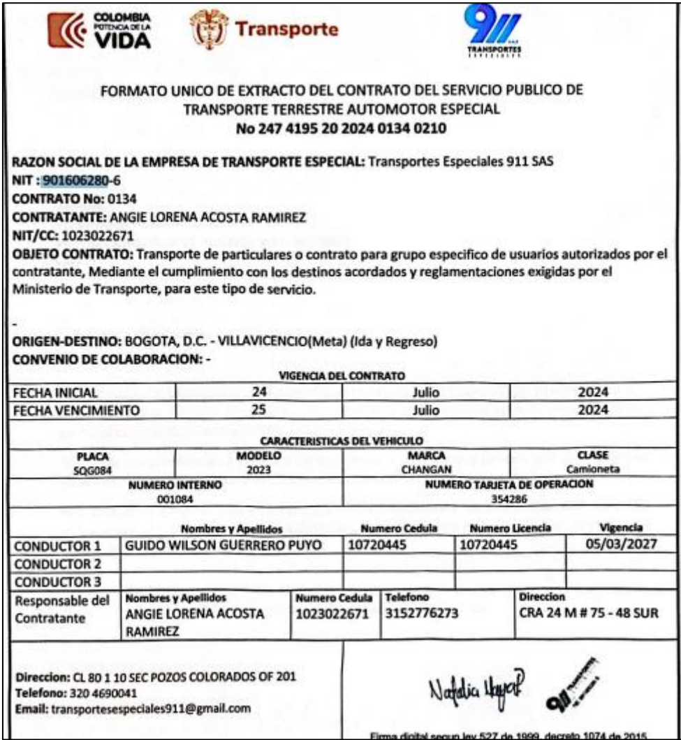
Imagen 3. Captura del Formato Único de Extracto de Contrato aportada mediante la solicitud de salida No. 20245341404842, correspondiente al 25/07/2024.

Es así como, esta Dirección de Investigaciones procedió a analizar la precitada solicitud, logrando establecer que (i) el IUIT que originó la inmovilización es el No. 10771A del 24/04/2024, es decir, se encuentra relacionado con el informe que nos ocupa para el caso en particular (ii) se aportó entre otros documentos, copia del Formato Único de Extracto de Contrato (FUEC) donde se logra identificar que la empresa encargada de la operación del automotor es TRANSPORTES ESPECIALES 911 S.A.S., como se evidencia a continuación: