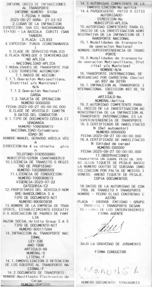
Imagen 1. Informe Único de Infracciones al Transporte No. 9109A de 27/09/2023 Aportado por la DITRA

"Por la cual se ordena la apertura de una investigación y se formula pliego de cargos en contra de la empresa SOCIEDAD LAMKARGA S.A.S. "