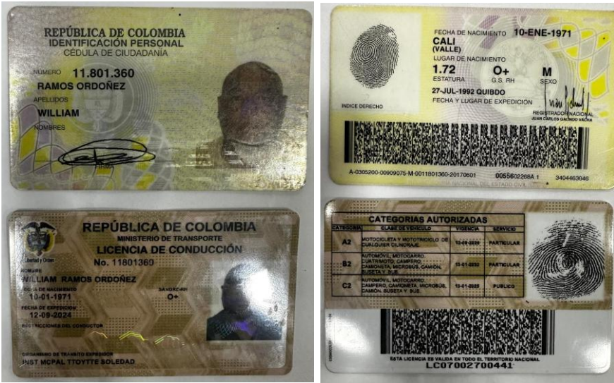
Imagen No 3. Tomada del informe la visita administrativa Memorando No.20241000157173 del 19 de noviembre de 2024.

Sin embargo, al cotejar la información con el informe de auditoría del Organismo Evaluador de la Conformidad (OEC), el instructor mencionado, no hacia parte de los instructores que se relacionan en el informe presentado y que se encuentran autorizados, como se evidencia a continuación: