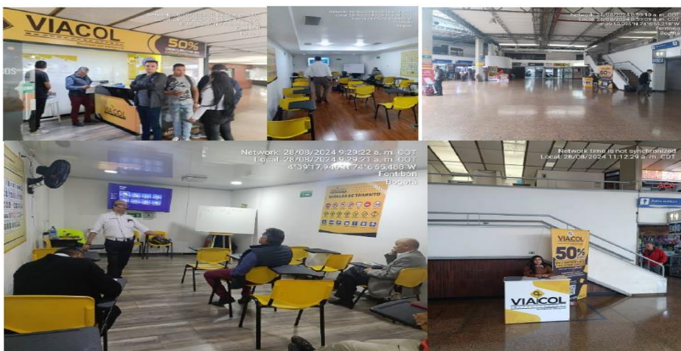
Imagen No 3. Imagen tomada del informe de visita allegado según Memorando interno No.20248000106663 del 9 de septiembre 2024.

En conjunto de la información reportada, se allegó registro fotográfico que da cuenta de los presuntos incumplimientos evidenciados durante la visita de inspección efectuada el 28 de agosto de 2024 en las instalaciones del Centro Integral de Atención, específicamente en lo relacionado con la ausencia de la oficina administrativa conforme se observa a continuación: