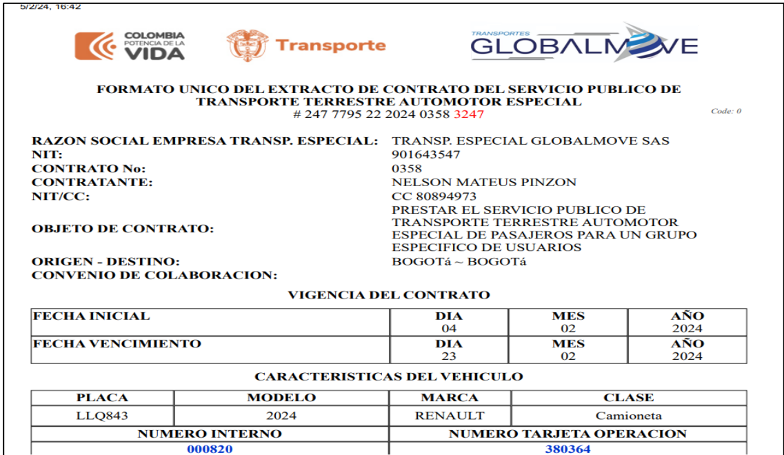
Imagen 3. Captura del Formato Único de Extracto de Contrato aportada mediante el 20245340344742, correspondiente al 07/02/2024 .

Es así como, esta Dirección de Investigaciones procedió a analizar la precitada solicitud, logrando establecer que (i) el IUIT que originó la inmovilización es el No. 1015402601 del 04/02/2024, es decir, se encuentra relacionada con el informe que nos ocupa para el caso en particular (ii) se aportó entre otros documentos, copia del Formato Único de Extracto de Contrato (FUEC) donde se logra identificar que la empresa encargada de la operación del automotor es TRANSPORTE ESPECIAL GLOBALMOVE S.A.S., como se evidencia a continuación: