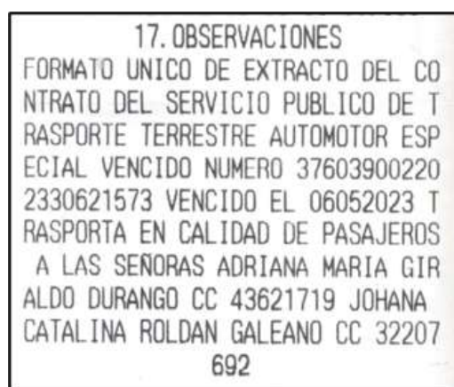
Imagen 1. Captura de pantalla IUIT No. 722A de 10 de mayo de 2023

Mediante radicado 20235342423292 de fecha 04 de octubre de 2023, fue allegado el Informe Único de Infracción al Transporte No. 722A de 10 de mayo de 2023, impuesto al vehículo de placa KOL448, vinculado a la empresa AL TRANS S.A.S. con NIT. 900946734-2 , toda vez que se encontró que: