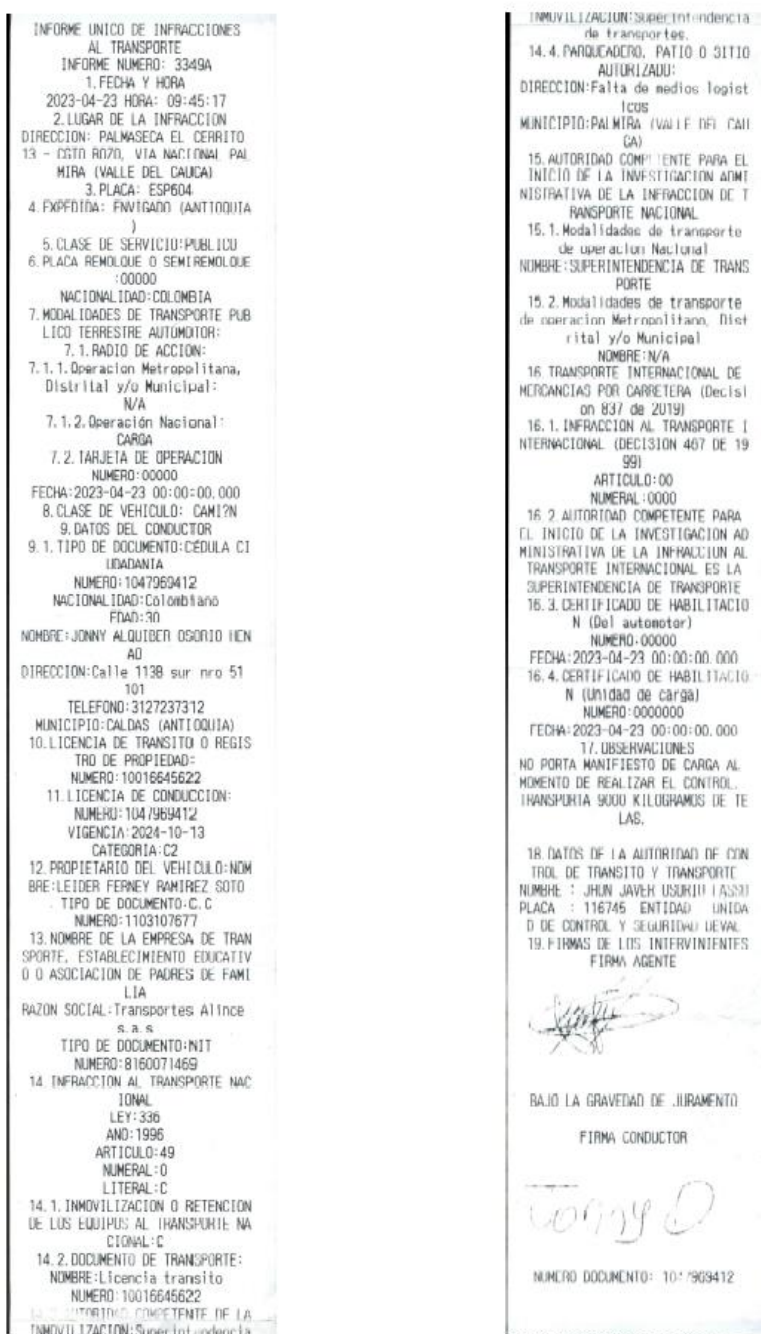
Imagen 1. Informe Único de Infracciones al Transporte No. 3349A del 23/04/2023

Mediante Informe Único de infracciones al Transporte No. 3349A del 23/04/2023, el agente de tránsito impuso infracción al vehículo de placas ESP604 debido a que conforme a lo descrito en la casilla de observaciones el automotor: "(...) NO PORTA MANIFIESTO DE CARGA AL MOMENTO DE REALIZAR EL CONTROL TRANSPORTA 9000 KILOGRAMOS DE TELAS(...)" así: