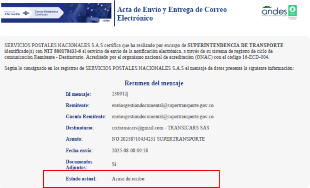
Imagen No.3. Soporte de envío y de entrega del Oficio de Salida No. 20258710434231 del 6 de agosto de 2025.

2025 26 y entregado el día 8 de agosto de 2025 27 y, (ii) no se allegó a esta Superintendencia respuesta alguna por parte de la Investigada. A continuación, se presenta el soporte de envío y entrega del mentado requerimiento de información: