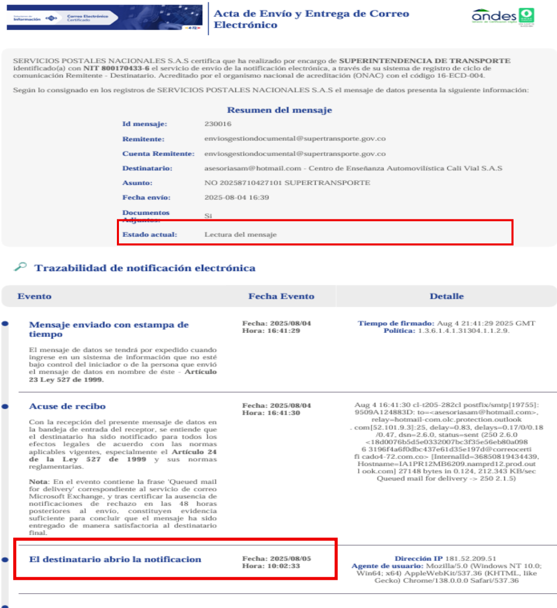
Imagen No. 4. Soporte de envío y de entrega del Oficio de Salida No.20258710427101 del 4 de agosto de 2025.

En consecuencia, se tiene que la Investigada presuntamente incumplió con su obligación de suministrar la información que en una (1) ocasión le fue legalmente requerida por la Superintendencia de Transporte, dentro del término otorgado para ello.