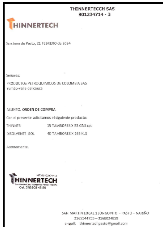
Imagen . orden de compra expedida por THINNERTECH de 21/02/2024

expedida por THINNERTECH de fecha 21 de febrero de 2024, como se muestra a continuación: