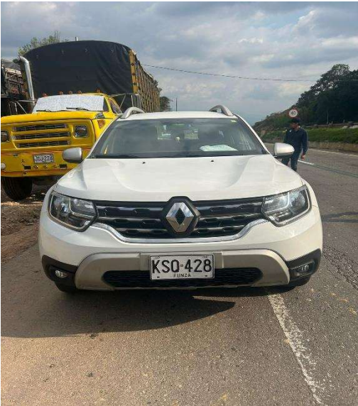
IMAGEN PARTE ANTERIOR