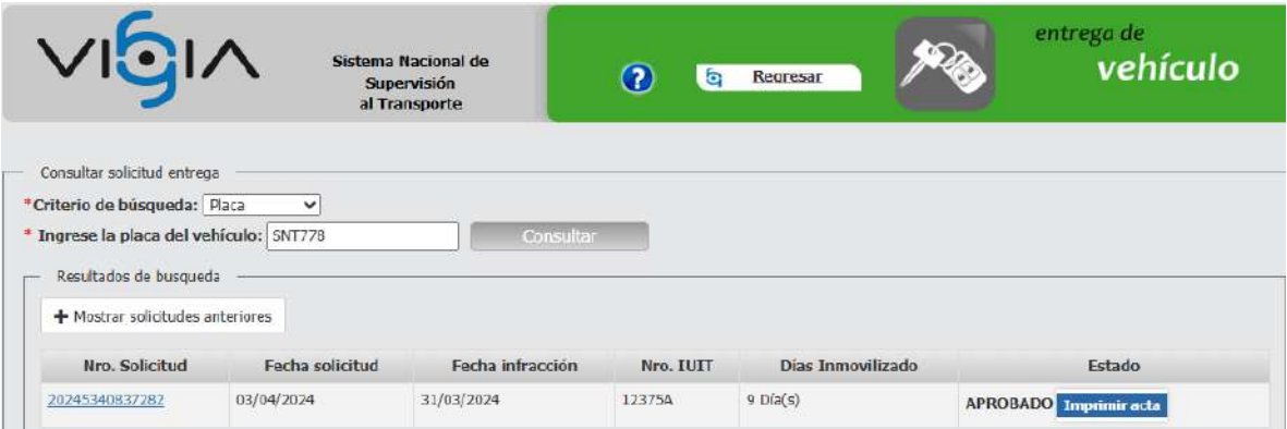
Imagen 1. Consulta ST realizada al link http://vigia.supertransporte.gov.co en el aplicativo VIGIA- Solicitud de salida No. 20245340837282 del 3 de abril de 2024

Ahora bien, este Despacho con el fin de identificar debidamente el sujeto activo de la infracción, procedió a verificar la plataforma VIGIA - sistema Nacional de Supervisión al Transporte- en el módulo de "consultas solicitud de inmovilizaciones", utilizando como criterio de búsqueda la placa SNT778, resultado el cual arrojó, una solicitud de salida de vehículo con radicado No. 20245340837282 , del 3 de abril de 2024 , tal como se observa a continuación: