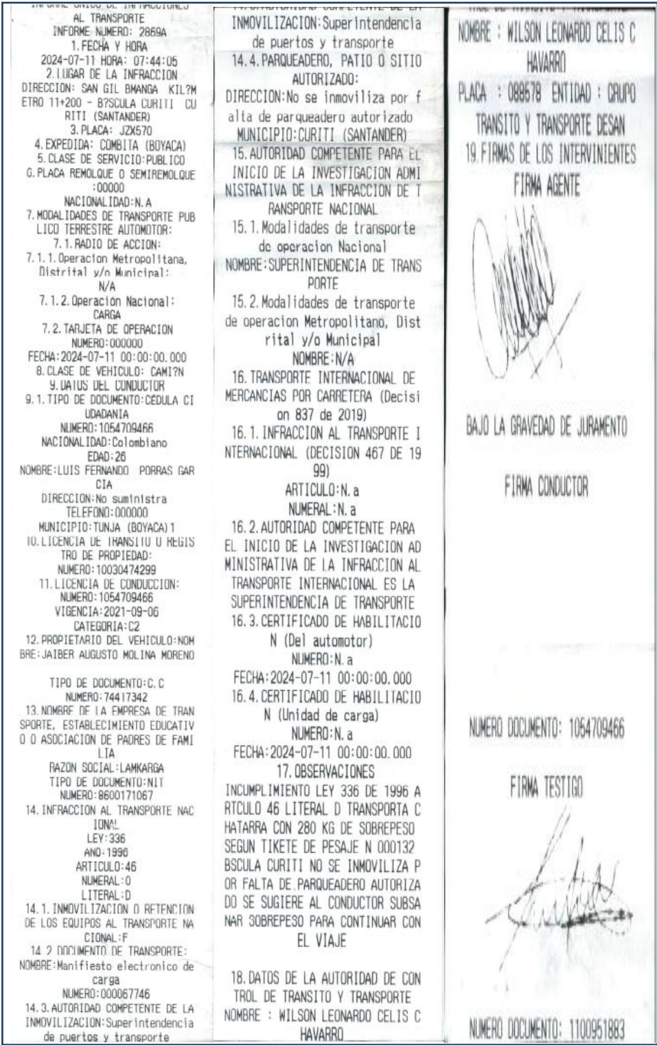
Imagen 1. Informe Unico de Infracciones al Transporte No. 2869A de 11/07/2024

"Por la cual se ordena la apertura de una investigación y se formula pliego de cargos en contra de la empresa SOCIEDAD LAMKARGA S.A.S. "