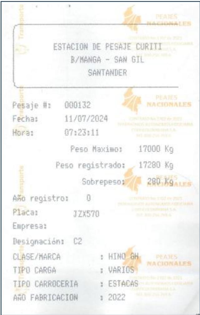
Imagen 2. Tiquete de pesaje estación Curití 1 No. 000132 de 11/07/2024.

"Por la cual se ordena la apertura de una investigación y se formula pliego de cargos en contra de la empresa SOCIEDAD LAMKARGA S.A.S. "