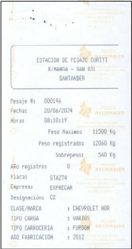
Imagen 2. Tiquete de báscula No. 000146 del 20/06/2024.

"Por la cual se ordena la apertura de una investigación y se formula pliego de cargos en contra de la empresa TRANSPORTES EXPRECAR SOCIEDAD POR ACCIONES SIMPLIFICADA "