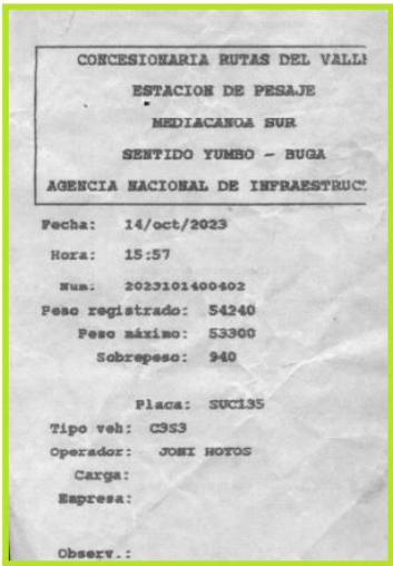
Imagen 2. Tiquete de báscula No. 2023101400402 del 14/10/2023

"Por la cual se ordena la apertura de una investigación y se formula pliego de cargos en contra de la empresa TRANSPORTES TERRESTRES DE CARGA LTDA "