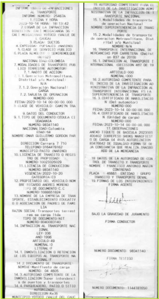
Imagen 1. Informe Único de Infracciones al Transporte No. 25467A del 14/10/2023.

En este orden de ideas, el agente de tránsito describió en la casilla 17 de observaciones del precitado Informe único de Infracciones al Transporte que: "(...) ANEXO TIQUETE DE BASCULA 2023101400402 SOBREPESO 940KG MANIFIESTO DE CARGA 04 4605 AUTORIZACION 83476642 DE IGUALDAD FORMA SE DEJA CONSTANCIA QUE REALIZA TRASBORDO DE LA MERCANCIA (...) ", como se evidencia a continuación: