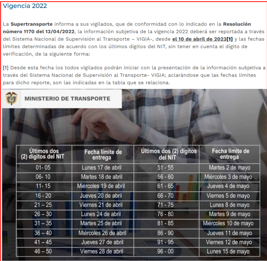
Imagen No. 1. Plazos de cargue y envío de la información según NIT 13

Así las cosas, y para el caso en concreto, el NIT de la investigada sin el dígito de verificación corresponde al número 17064113 y en tal sentido conforme lo indica la Resolución arriba mencionada, teniendo en cuenta los últimos dos (2) dígitos del NIT, el plazo que tenía AUTOCLUB CASANARE AGUAZUL , para reportar la información correspondiente a los estados financieros de la vigencia 2022, fenecía el día Miercoles 19 de Abril de 2023 .