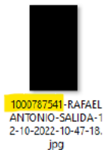
Imagen No. 4. Fotografía que fue tomada al aprendiz el día 12 de octubre de 2022, a la salida de la clase “práctica” en el horario comprendido de 09:00AM a 11:00AM. 9

Adicionalmente, el Consortio para CEAS y CIAS procedió a realizar una nueva validación referente al uso de la plataforma tecnológica SICOV respecto al ingreso de un aprendiz a las sesiones de formación práctica programadas por AUTOCAR , siendo allegada la siguiente información: