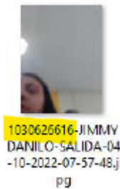
Imagen No. 2. Fotografía que fue tomada al aprendiz el día 04 de octubre de 2022, a la salida de la clase “práctica” en el horario comprendido de 07:00AM a 08:00AM. 7

De igual manera, el Consortio para CEAS y CIAS procedió a realizar una nueva validación referente al uso de la plataforma tecnológica SICOV respecto al ingreso de un aprendiz a las sesiones de formación práctica programadas por AUTOCAR , siendo allegada la siguiente información: