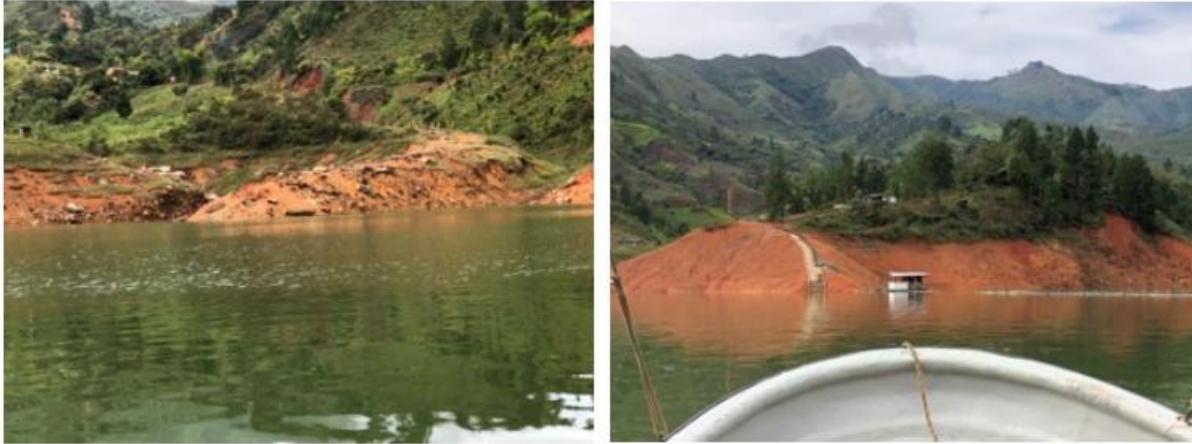
Ilustración 5. Embarcadero “Mindala Margen Izquierda”