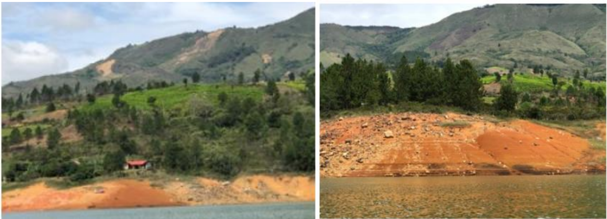
Ilustración 9. Muelle - Embarcadero “La Base Margen Izquierda”

La infraestructura está ubicada en una zona rocosa y montañosa, no existe construcción. El atraque se realiza de manera flotante en el caso de las barcazas y aislado en el caso de las lanchas, sólo se observa un camino demarcado de tierra; se brinda servicio de transporte de carga y de pasajeros.