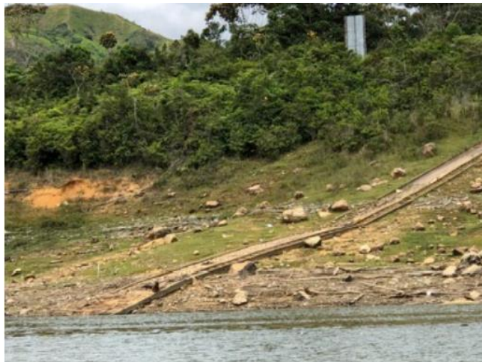
Ilustración 17. Muelle - Embarcadero “San José Margen Izquierda”

La infraestructura está ubicada en una zona rocosa y montañosa, consta de una rampa de concreto que cuenta con escaleras, sin pasamanos. El atraque se realiza de manera flotante en el caso de las barcasas y aislado en el caso de las lanchas; se brinda servicio de transporte de carga y de pasajeros.