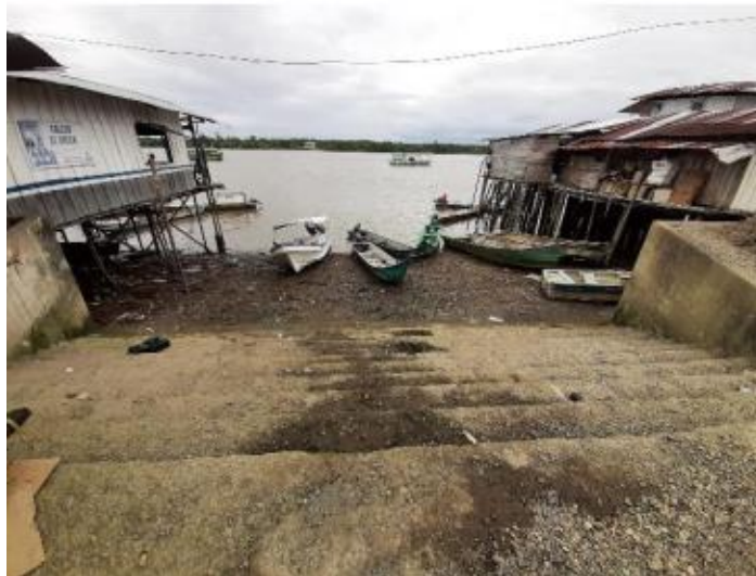
Ilustración 24. Embarcadero la Esso o Bajada el Meca