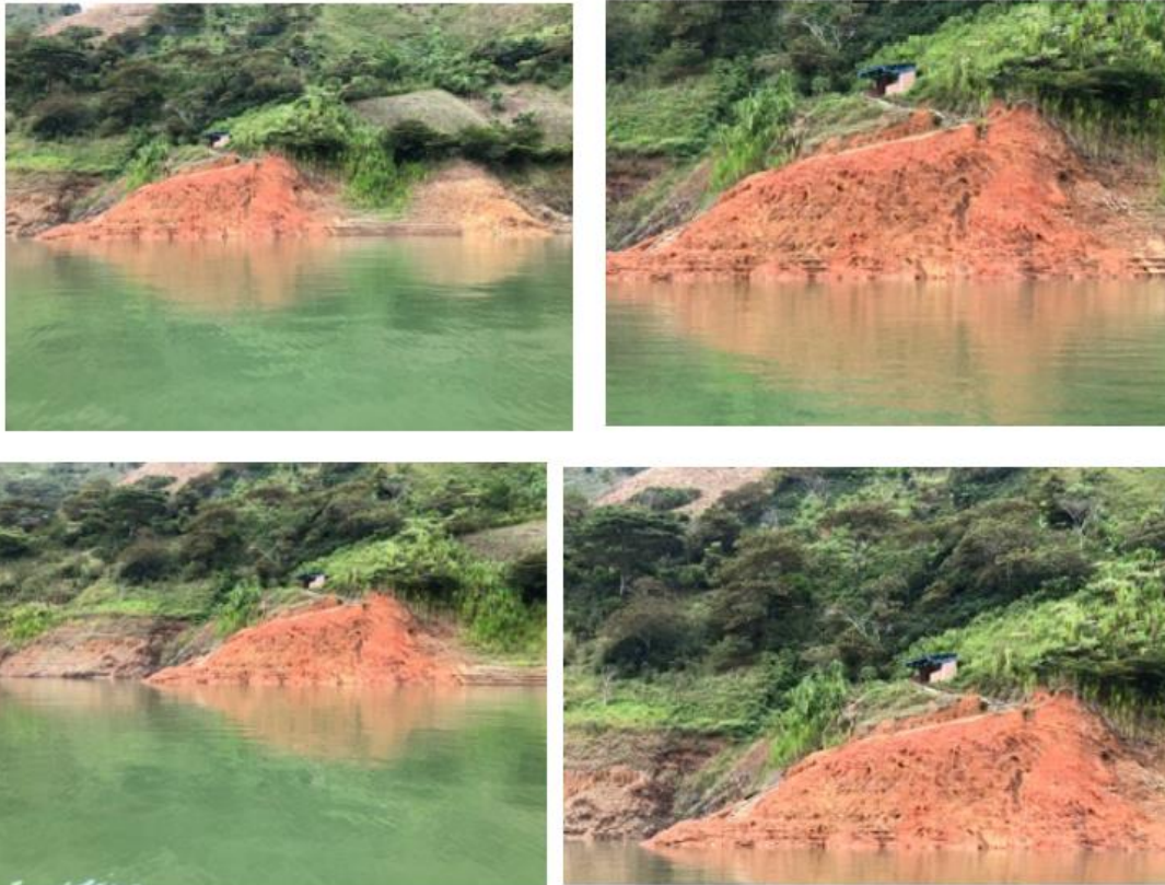
Ilustración 4. Embarcadero “Montañita Margen Izquierda”