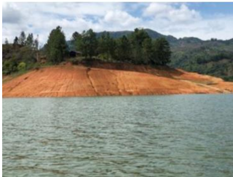
Ilustración 11. Muelle - Embarcadero "Morales Margen Derecha"