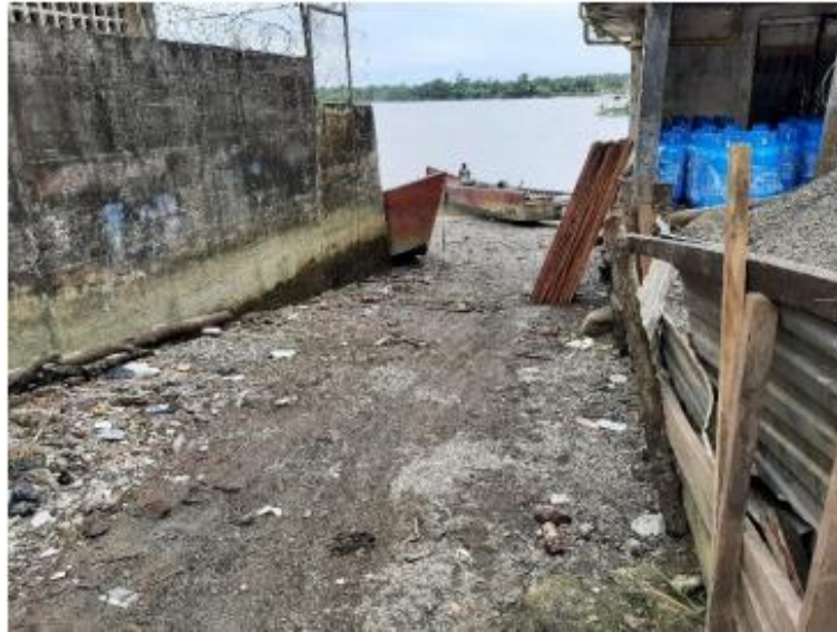
Ilustración 25. Muelle la Esso