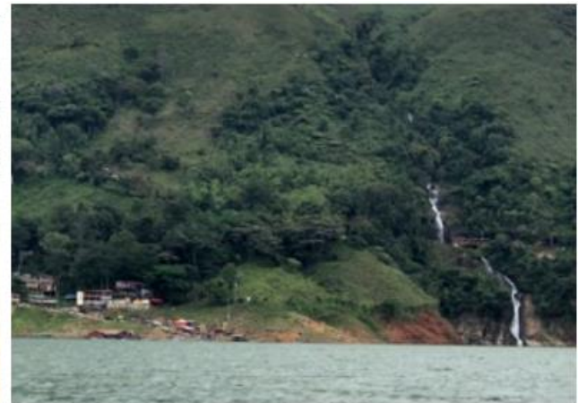
Ilustración 2. Muelle- Embarcadero “Casa de Teja”