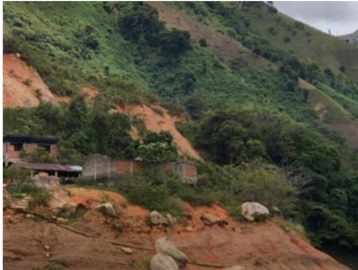
Ilustración 16. Muelle - Embarcadero “Puerto Huevo”

La infraestructura está ubicada en una zona rocosa y montañosa, consta de una rampa de concreto y escaleras con pasamanos. El atraque se realiza de manera flotante en el caso de las barcasas y aislado en el caso de las lanchas; se brinda servicio de transporte de carga y de pasajeros. En este muelle - embarcadero se observa que hay existencia de lanchas de los habitantes de la zona, quienes eventualmente prestan servicio informal de transporte de pasajeros a sus vecinos.