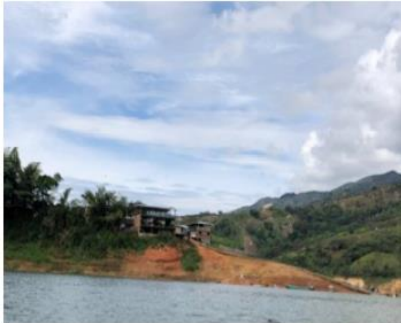
Ilustración 14. Muelle- Embarcadero "Santa Bárbara Margen Derecha"