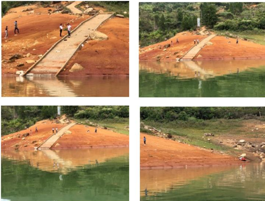
Ilustración 6. Muelle- Embarcadero “San Vicente Margen Izquierda”

La infraestructura está ubicada en una zona rocosa y montañosa, consta de una rampa de concreto. El atraque se realiza de manera flotante en el caso de las barcazas y aislado en el caso de las lanchas; se brinda servicio de transporte de carga y de pasajeros.