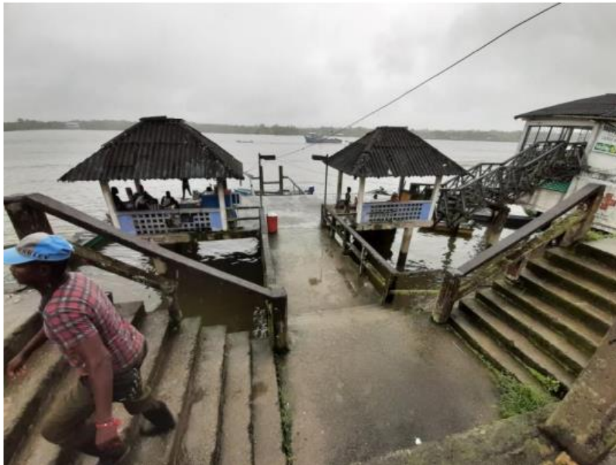
Ilustración 20. Muelle Turístico

En la fecha de realización de la visita el punto se encontraba inactivo, se tuvo conocimiento que la administración municipal planea realizarle mejoras a su infraestructura.