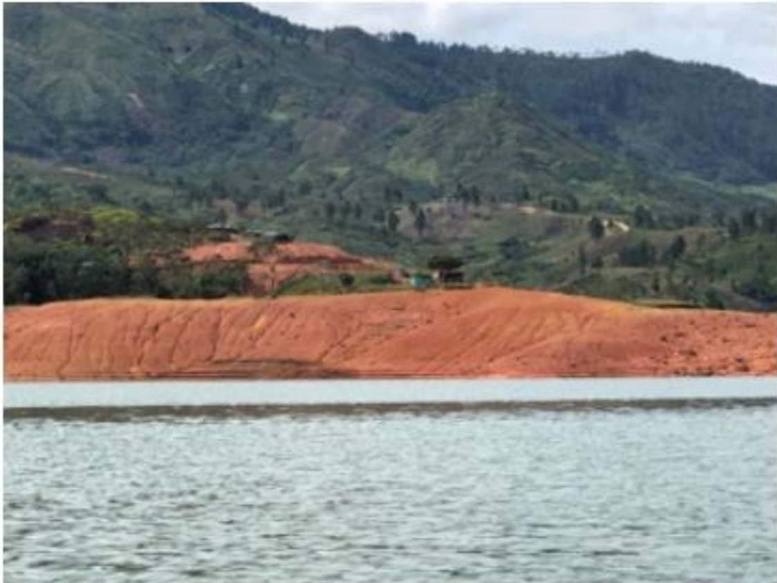
Ilustración 10. Muelle - Embarcadero “Los Guayabos”

La infraestructura está ubicada en una zona rocosa y montañosa, no existe construcción. El atraque se realiza de manera flotante en el caso de las barcazas y aislado en el caso de las lanchas, sólo se observa un camino demarcado de tierra; se brinda servicio de transporte de carga y de pasajeros.