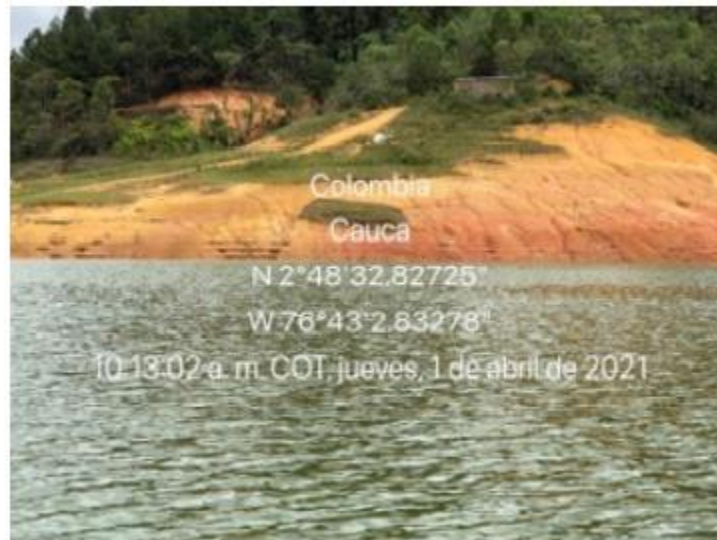
Ilustración 13. Muelle - Embarcadero “Buena Vista Margen Izquierda”

La infraestructura está ubicada en una zona rocosa y montañosa, no existe construcción. El atraque se realiza de manera flotante en el caso de las barcazas y aislado en el caso de las lanchas, sólo se observa un camino demarcado de tierra; se brinda servicio de transporte de carga y de pasajeros.