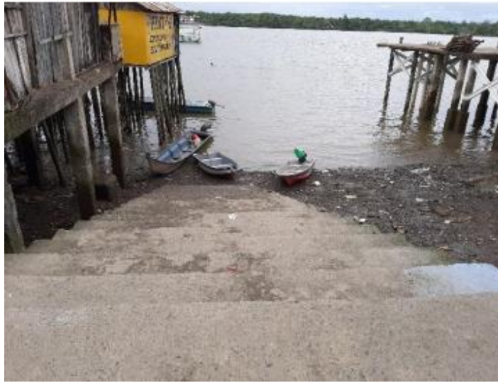
Ilustración 23. Embarcadero Punta del Este o Estodero

De acuerdo con la información obtenida, sirve como atracadero de embarcaciones particulares.