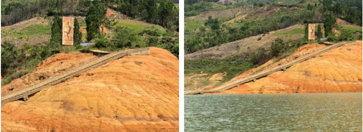
Ilustración 12. Muelle - Embarcadero “Arenal Margen Izquierda”