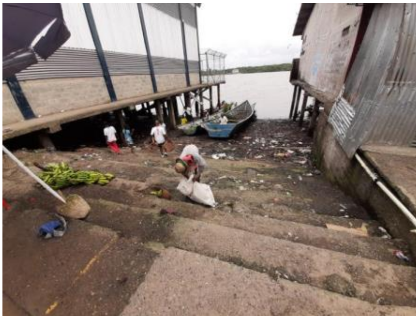
Ilustración 22. Muelle La Galería

Allí atracan las embarcaciones de los corregimientos pertenecientes a Guapi, realizando venta de productos como plátano, pescado, entre otros; pero desde la misma embarcación.