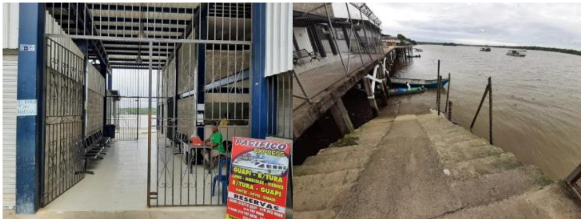
Ilustración 21. Muelle Municipal

La actividad de pasajeros se realiza a través de una escalera, donde no se observaron defensas, bitas de amarre y la escalera tiene una parte lisa que representa un riesgo para los usuarios, el otro espacio es una pasarela para el descargue de mercancía para embarcaciones mayores de cabotaje, donde no se observaron defensas.