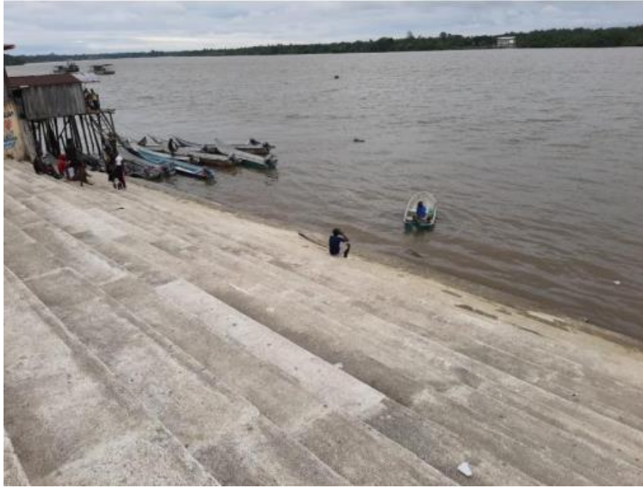
Ilustración 19. Embarcadero La Muralla