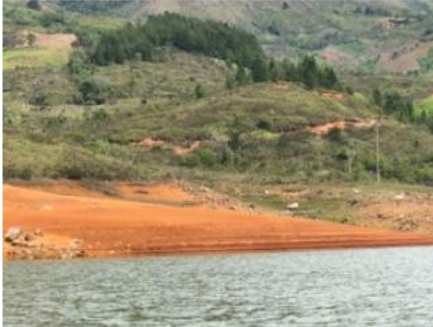
Ilustración 8. Muelle- Embarcadero “Magón Eje Central”