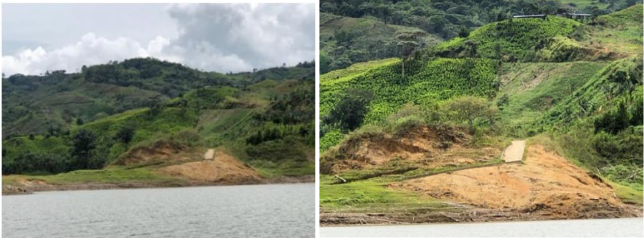
Ilustración 18. Muelle - Embarcadero “San José Margen Derecha”

La infraestructura está ubicada en una zona rocosa y montañosa y solo consta de una rampa de concreto. El atraque se realiza de manera flotante en el caso de las barcazas y aislado en el caso de las lanchas; se brinda servicio de transporte de carga y de pasajeros.