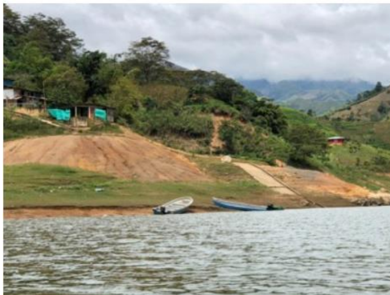
Ilustración 15. Muelle - Embarcadero "Puerto Cabildo"

La infraestructura está ubicada en una zona rocosa y montañosa y sólo consta de una rampa de concreto. El atraque se realiza de manera flotante en el caso de las barcazas y aislado en el caso de las lanchas; se brinda servicio de transporte de carga y de pasajeros. En este muelle-embarcadero se observa que hay existencia de lanchas de los habitantes de la zona, quienes eventualmente prestan servicio informal de transporte de pasajeros, a sus vecinos.