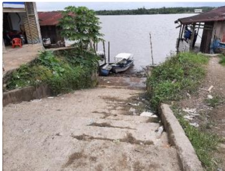
Ilustración 26. Muelle del Hospital o Yamaha

Durante el operativo no se observó prestación del servicio informal, sólo embarcaciones menores particulares.