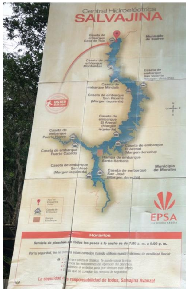
Ilustración 1. Mapa de los principales muelles y embarcaderos del embalse la Salvajina, en todos se presta servicio mixto, es decir, transporte de pasajeros y de carga