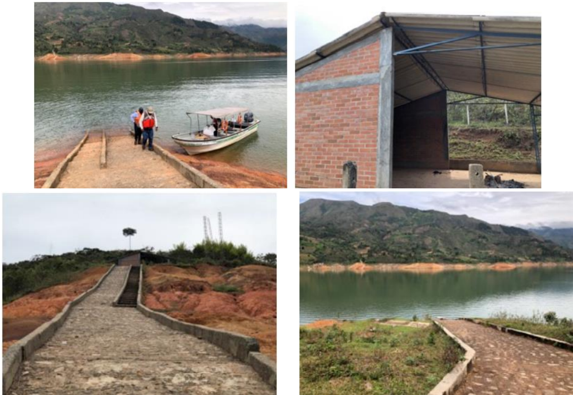
Ilustración 7. Muelle- Embarcadero “San Vicente Margen Derecha”

Este muelle - embarcadero cuenta con una caseta que sirve como espacio de espera para los usuarios.