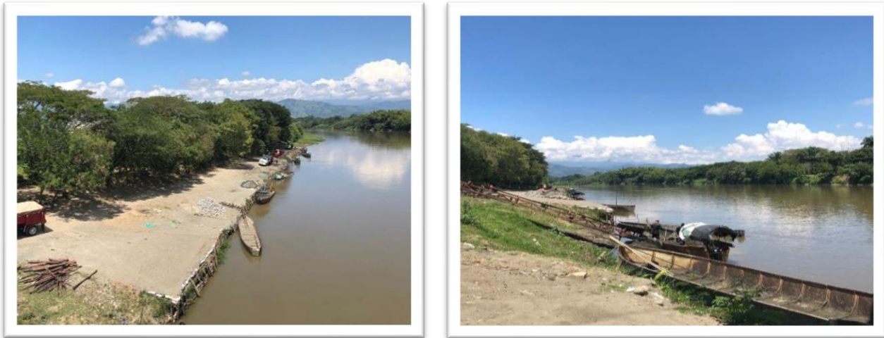
Ilustración 3 Parador Náutico o Muelle Turístico de La Virginia