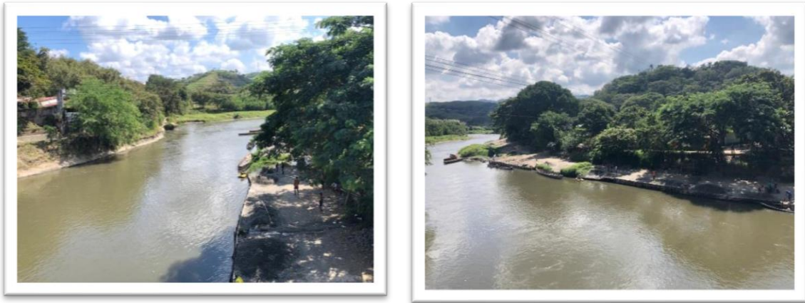
Ilustración 1. Muelle Puente Simón Bolívar

Durante el operativo, se observó la operación de carga de arena, la cual se realiza de manera manual.