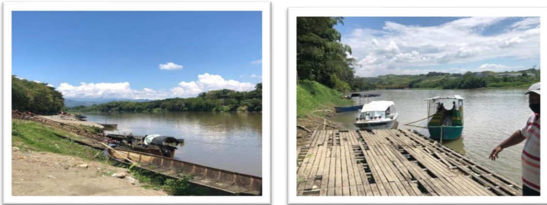
Ilustración 2. Embarcaciones