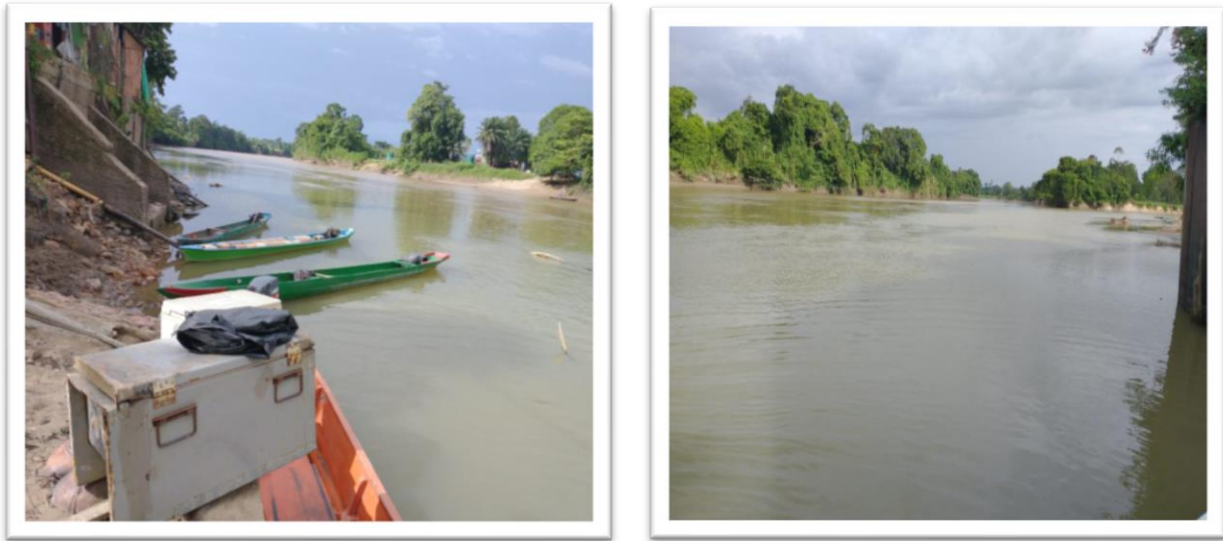
Ilustración 1. Embarcadero la Gabarra