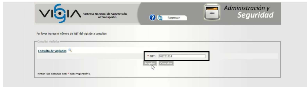
Imagen No. 4. Consulta ST realizada al link http://vigia.supertransporte.gov.co modulo vigilado de la identificación de la empresa en el aplicativo VIGIA

Dicho lo anterior, la Dirección de Investigaciones de Tránsito y Transporte consultó la plataforma VIGIA ingresando a través de la página web http://vigia.supertransporte.gov.co/ 21 en el "Modulo vigilado", utilizando el número de identificación tributaria (NIT) de la Investigada, tal como se muestra a continuación: