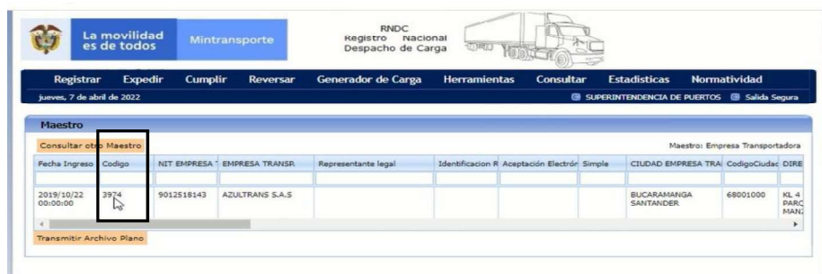
Imagen No.1 consulta ST realizada en el link https://rmdc.mintransporte.gov.co. de la identificación de la empresa en el aplicativo RNDC, código de registro No. 3974

La Dirección de Investigaciones de Tránsito y Transporte Terrestre el día 07 de abril de 2022, procedió a realizar la consulta en la página web https://rmdc.mintransporte.gov.co/ 19 en el módulo "consultar" a través de la cual evidencia el registro de la empresa AZUTRANS SAS ante la plataforma RNDC, donde le fue asignado el código 3974 que la identifica dentro del aplicativo como se observa a continuación: