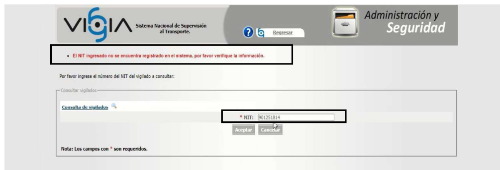
Imagen No. 5. Consulta ST realizada al link http://vigia.supertransporte.gov.co modulo vigilado de las entregas de control y seguimiento a las infracciones de tránsito de los conductores

Realizada la consulta por parte de la Dirección de Investigaciones de Tránsito y Transporte se observó que, la Investigada no se encuentra registrada en el sistema nacional de supervisión al transporte VIGIA, lo cual permiten evidenciar el incumplimiento de las obligaciones por parte de la empresa AZUTRANS SAS , como a continuación se evidencia: